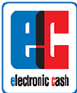
ec electronic cash

Mindestens das abgebildete Piktogramm "electronic cash PIN-Pad" oder "girocard" ist als Akzeptanzzeichen im Kassensbereich zu verwenden. Bei neu eingerichteten Kassen-Standorten ist lediglich "girocard" als Akzeptanzzeichen zu verwenden.