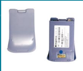
Leistungsstarker Li-Ion Akku

Uneingeschränkte Mobilität in allen deutschen Mobilfunknetzen