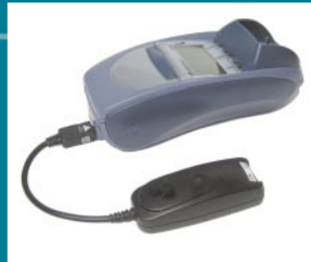
Back-Up Modem und RS232 Schnittstelle